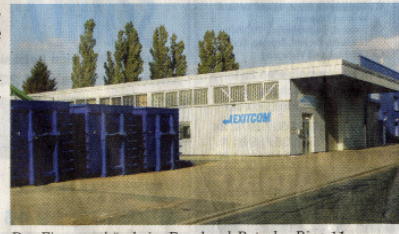
Das Firmengebäude im Burchard-Retschy-Ring 11