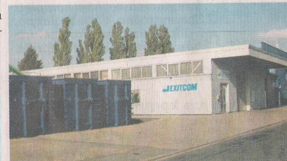
Das Firmengebäude im Burchard-Retschy-Ring 11